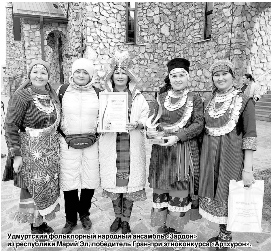
Удмуртский фольклорный народный ансамбль «Зардон» из республики Марий Эл; победитель Гран-при этноконкурса «Артурон».

Многовековая дружба народов и богатое разнообразие культур, великолепие национальных костюмов и пленительные звуки фольклорной музыки... Международный инклюзивный фестиваль этнического искусства «Алтын Майдан» впервые посетил Северную Осетию.