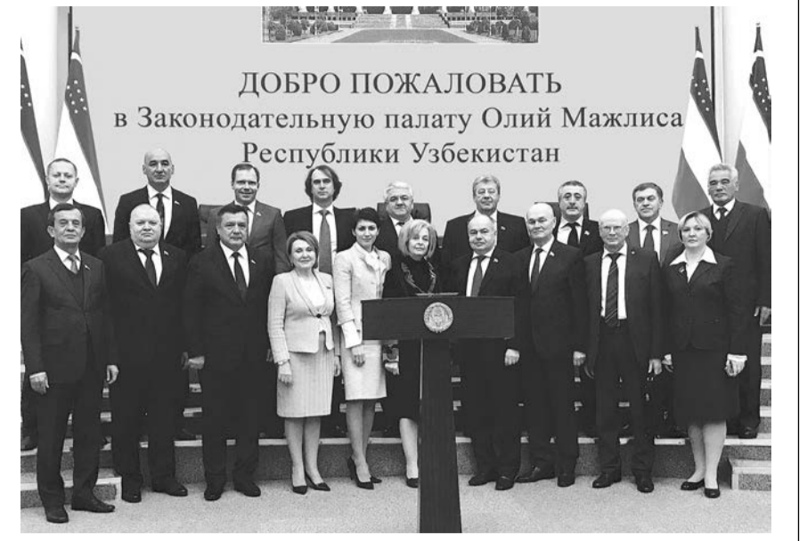
открытию еще одной яркой страницы в летописи доверительных отношений между двумя духовно близкими народами России и Узбекистана. Об этом, в частности, сказал в своем интервью

По мнению участников, столь значимые мероприятия на высоком государственном уровне свидетельствуют об