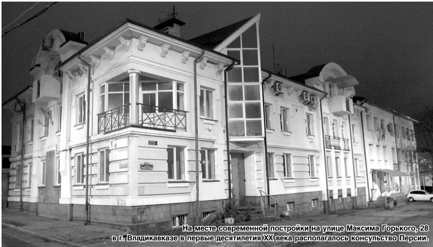
На месте современной постройки на улице Максима Горького, 28 в г. Владикавказе в первые десятилетия XX века располагалось консульство Персии.