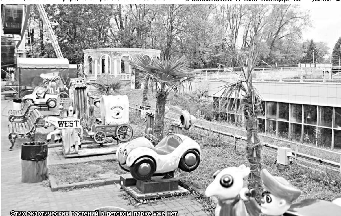
Этих экзотических растений в детском парке уже нет