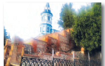
Идет реставрация стены Осетинской церкви