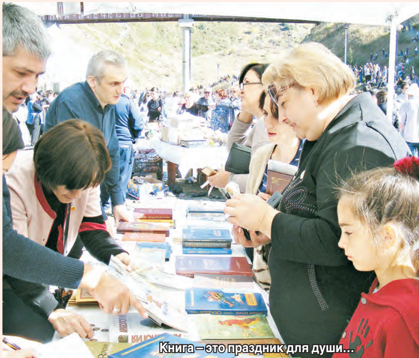
Книга – это праздник для души...

«Книжная лавка» приветствует своего читателя и предлагает ознакомиться с разноплановой литературой, которая непременно заинтересует внимательного и думающего