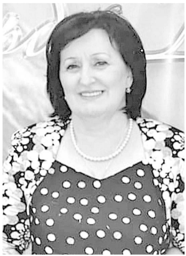
посвятила преподавательскому делу в родном вузе.

Счастлив тот, кто после себя оставляет добрый след. Кто при жизни становится солнцем, щедро дарящим свое тепло и свет окружающим.