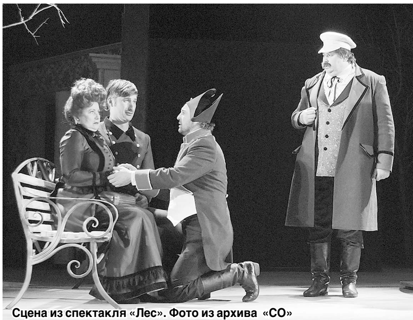
Сцена из спектакля «Лес».