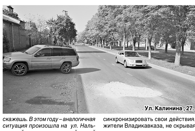
Ул. Калинина, 27.

скажешь. В этом году — аналогичная ситуация произошла на ул. Нальчикской: только уложенный новый асфальт был разрыт спустя... 2 часа газовой машиной, раскопавшими 20 кв. метров».