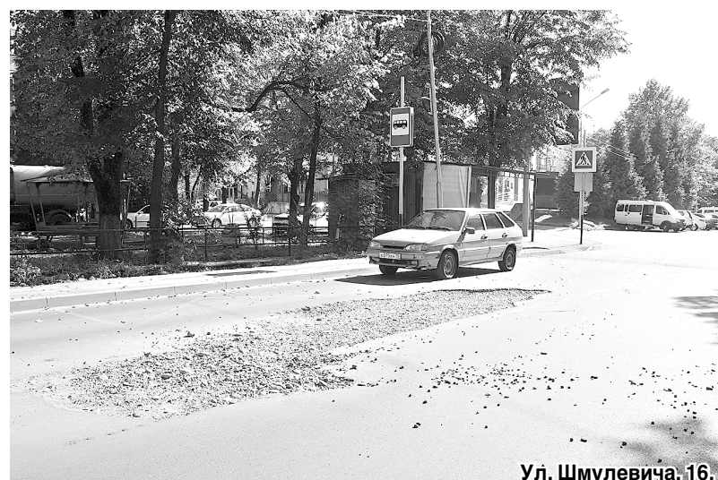
Ул. Шмулевича, 16.