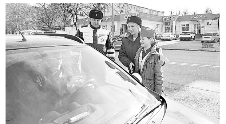
Пресс-служба ГИБДД МВД по РСО–А

С призывом быть внимательными за рулем к автолюбителям в своих письмах обратились учащиеся СОШ №38 г. Владикавказа, которые совместно с инспекторами ДПС и сотрудниками отделения пропаганды Управления Госавтоинспекции вышли на улицу для проведения профилактического мероприятия. Разъяснительная акция направлена на сокращение детского дорожно-транспортного травматизма, формирование правового сознания и повышение культуры вождения у участников дорожного движения.