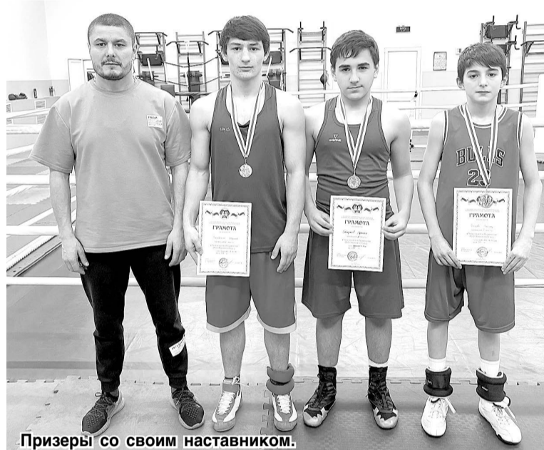
Призеры со своим наставником.

Участники соревнований сражались не только за награды, но и за возможность войти в состав республиканской сборной для участия в предстоящем первенстве Северо-Кавказского федерального округа.