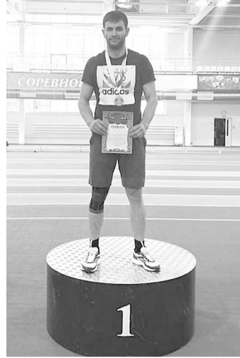
томонов есть шансы выступить на XVI паралимпийских летних играх в г. Токио (Япония), где будет разыграно 168 комплектов медалей в легкой атлетике.

Составе команды — спортсмены с ПОДА и нарушениями зрения — 34 и интеллектуальными нарушениями — 8. Кроме того, будет разыгран комплект медалей в эстафете. В составе команды — спортсмены с ПОДА и нарушениями зрения.