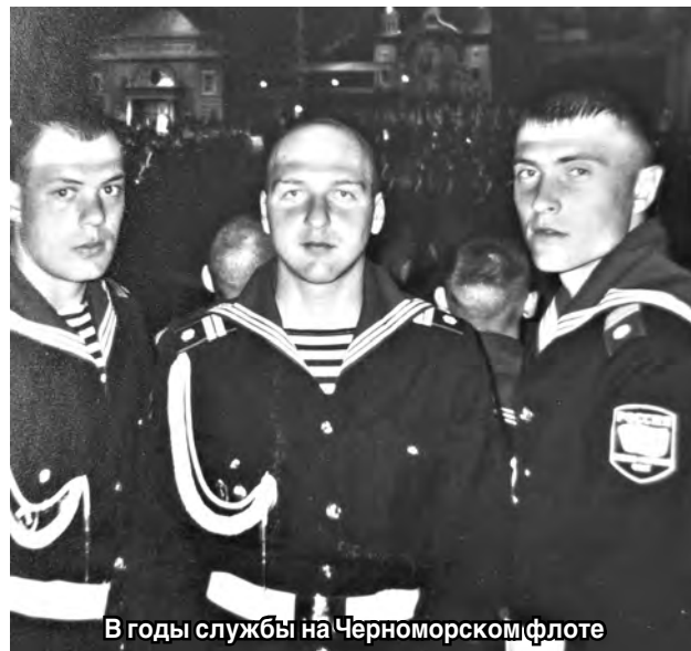
В годы службы на Черноморском флоте