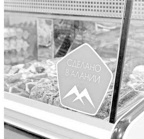
магазин, а создать площадку для знакомства с местными продуктами».

«Наша главная цель – познакомить жителей республики с местными производителями...»