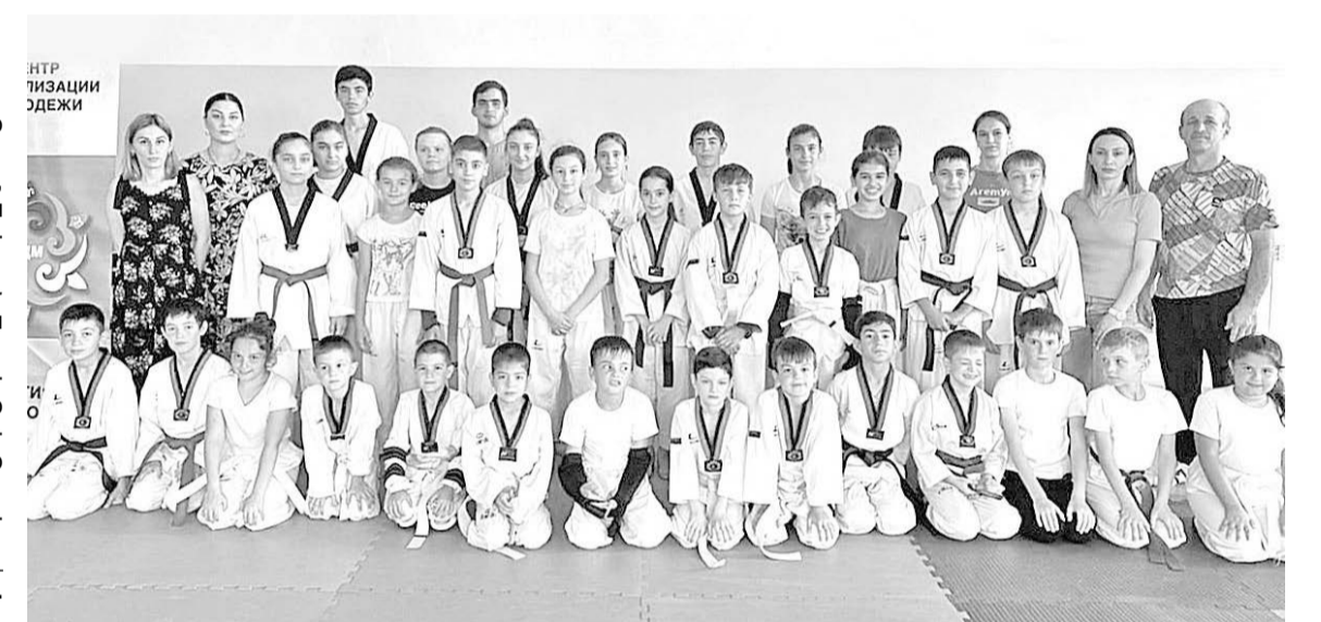
А. КУБАЛОВ. На снимке: участники турнира.

Организаторы турнира — ГБУ «Центр социализации молодежи» по Кировскому району и дирекция Карджинской спортшколы.