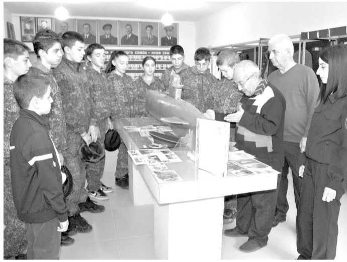
событий и испытать чувство гордости за родной район, республику, Россию.