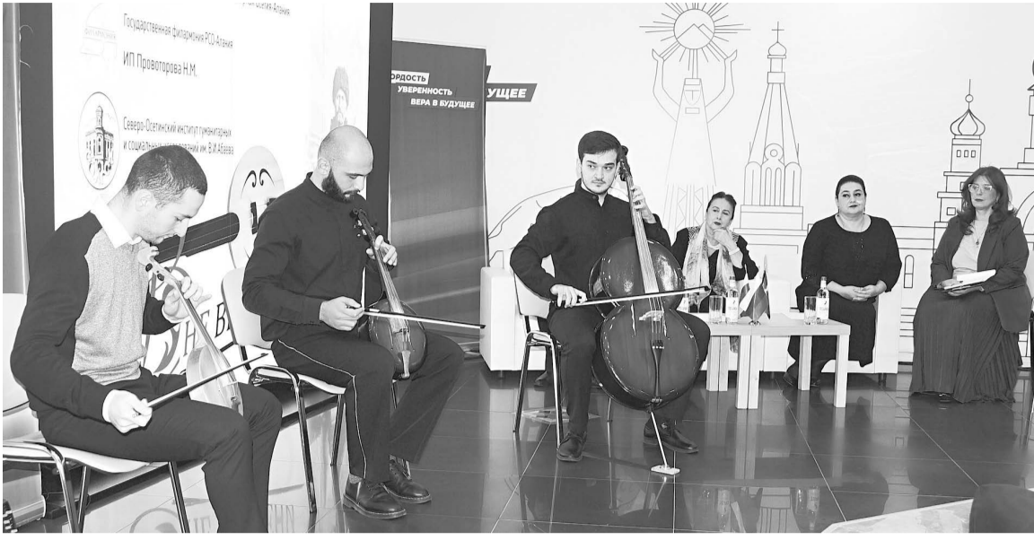
Придать новое звучание и жизнь старинному смычковому инструменту под названием «хъисын фандыр»...