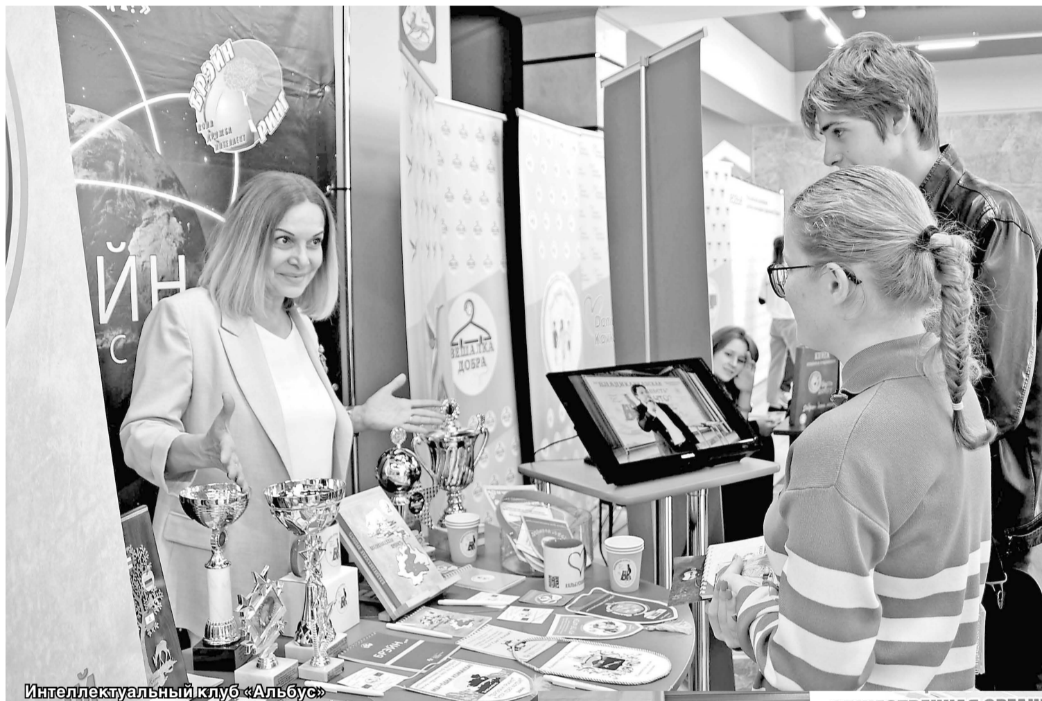
Интеллектуальный клуб «Альбус»