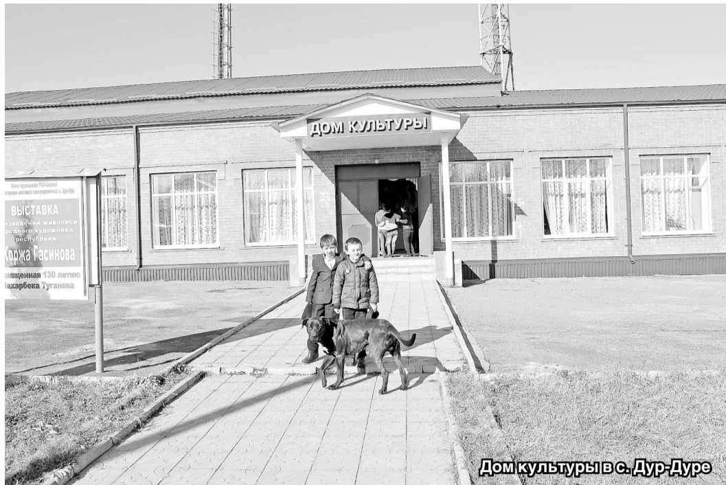
Дом культуры в с. Дур-Дур

Что же было сделано по этой подпрограмме в минувшем году? Во-первых, в рамках мероприятия «Развитие социальной инфраструктуры (создание, реконструкция, капитальный ремонт объектов социальной и культурной сферы)» завершен капитальный ремонт врачебной амбулатории с. Дур-Дур с объемом финансирования 9,6 млн рублей.