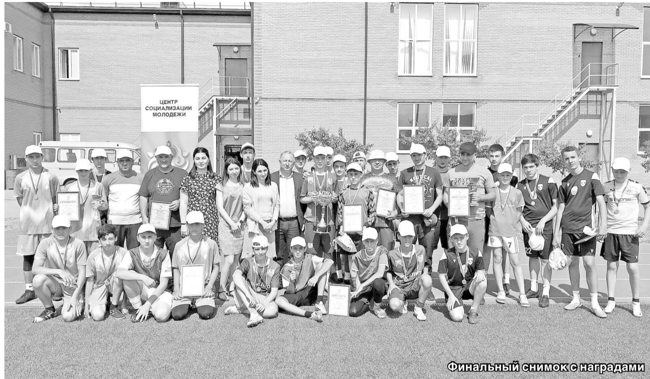
Финальный снимок с наградами

Во время матчей команды, настроенные на победу, добились постав-