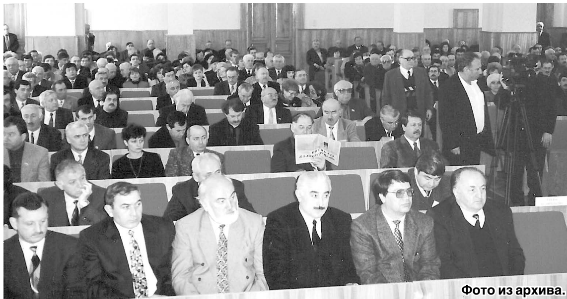
Фото из архива.