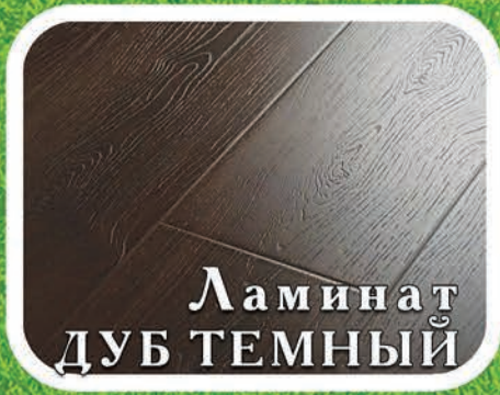
Ламинат ДУБ ТЕМНЫЙ