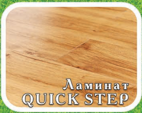
Ламинат QUICK STEP