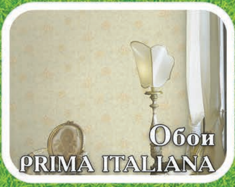
Обои PRIMA ITALIANA