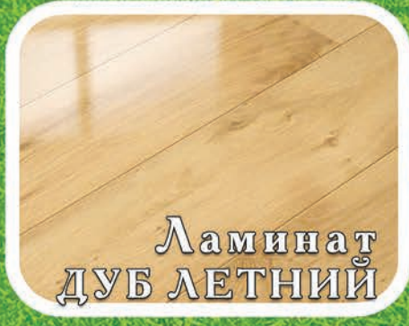
Ламинат ДУБ ЛЕТНИЙ