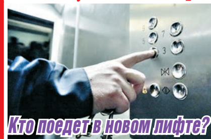
Кто поедет в новом лифте?