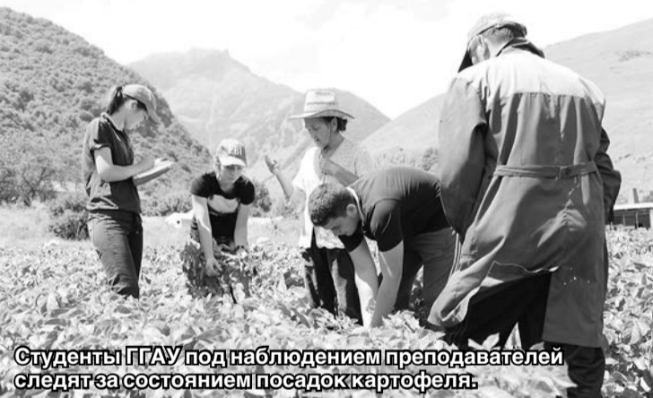
Студенты ГГАУ под наблюдением преподавателя следят за состоянием посадок картофеля.

Экологические условия как горных, так и предгорных зон Северо-Кавказского региона имеют отчетливо выраженный экстремальный характер и предъявляют довольно жесткие требования к биологическим особенностям возделываемых в регионе сельскохозяйственных культур, особенно к картофелю. Для нормального роста и развития в нашем регионе растения должны обладать широким диапазоном приспособляемости, обеспечивающим устойчивое формирование продуктивности в условиях быстрых изменений ведущих факторов окружающей среды — света, температуры и запаса продуктивной влаги в почве.