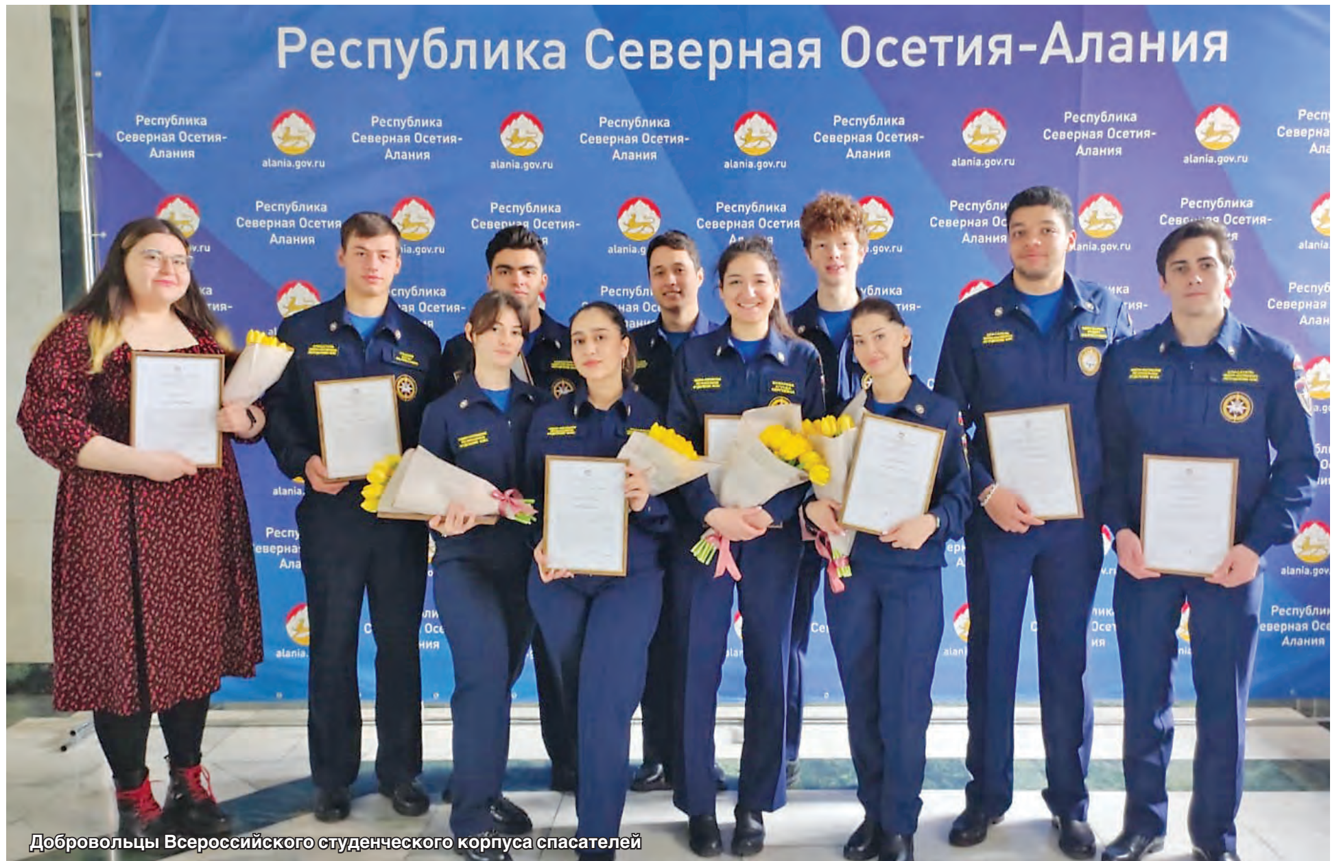
Добровольцы Всероссийского студенческого корпуса спасателей

В Доме правительства наградили волонтеров общественных организаций, принимавших самое активное участие в поддержке наших военнослужащих – добровольцев, а позднее – мобилизованных граждан.