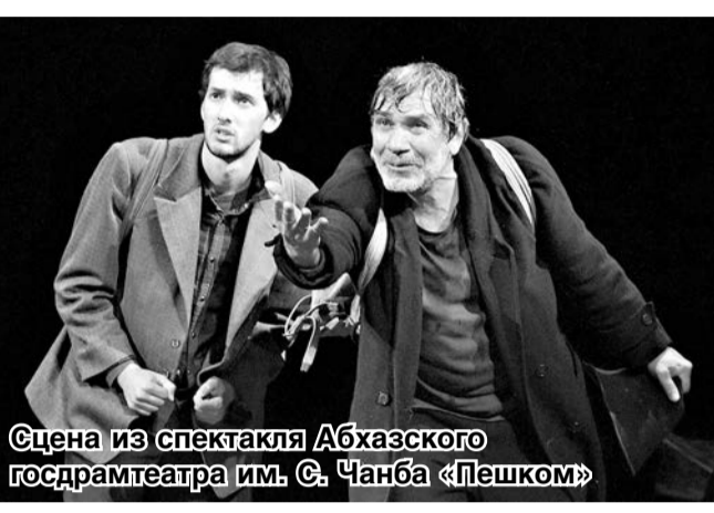
Сцена из спектакля Абхазского госдрамтеатра им. С. Чанба «Пешком»