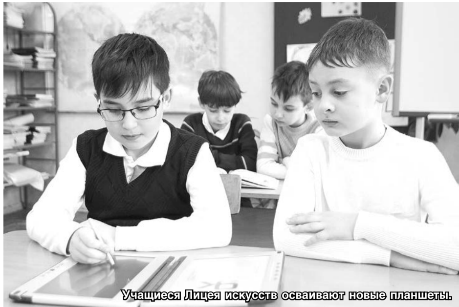
Учащиеся Лицея искусств осваивают новые планшеты.

— И даже есть финансирование на все вышеперечисленное?