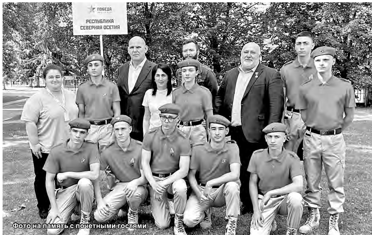
Фото на память с почетными гостями

На таком уровне «Виктория» представляет Северную Осетию уже в четвертый раз. В финале, проходившем на базе подмосковного парка «Патриот» и общеювского полигона «Алабино», участвовали 85 команд – победители региональных этапов, а также команды Донецкой и Луганской народных республик. Ребята состязались в стреловом, на огневом рубеже, в тактической игре на местности «Дорога победителей», конкурсе визиток, сдавали исторический тест. На огневом рубеже они продемонстрировали навыки раз-