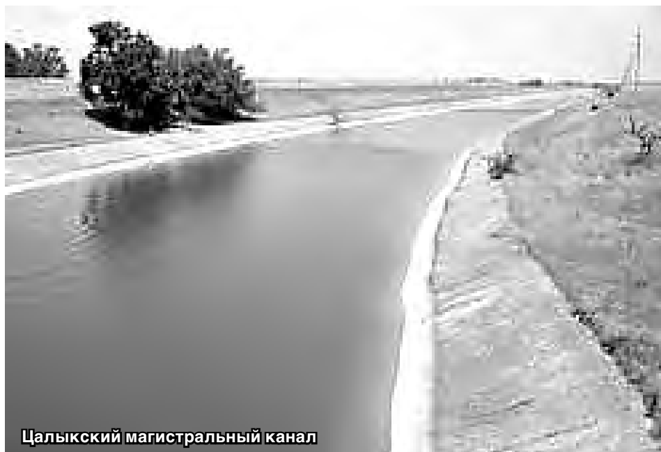
Цалыкский магистральный канал

ного сооружения и магистрального канала» в Пригородном районе, что позволило обеспечить бесперебойную подачу воды на орошаемые земли на площади 2237 гектаров, подпитку реки Черной, а также подачу воды в рыбные пруды на площади 105 гектаров. Реконструкция данного объекта повысила эксплуатационную надежность головного водозаборного сооружения и устранила угрозу затопления сельхозугодий и населенных пунктов селения Гизель и станицы Архонской с населением свыше 17 тыс. человек.