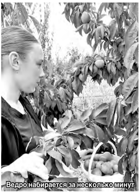
Ведро набирается за несколько минут

Собранный урожай будет реализовываться на рынках и в торговых центрах республики. Сливу можно употреблять как в свежем виде, так и для заготовок на зиму. Продукцию садоводов СПК «Де-Густо» с нетерпением ждут, спрос на нее огромный. И немудрено, ведь сливы из этого хозяйства отличаются медовым вкусом. Большое количество солнечных дней в Кировском районе делает плоды в разы слаще.