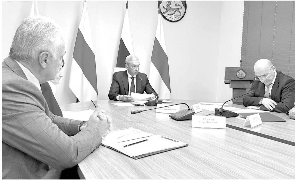
проектов создания комфортной городской среды.

В центре внимания и реализация проектов – победителей Всероссийского конкурса лучших