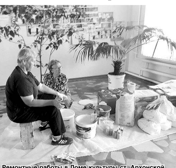
Ремонтные работы в Доме культуры ст. Архонской.