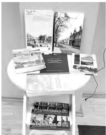
содержащиеся в статье о Владикавказе в так любимой многими из нас Википедии.