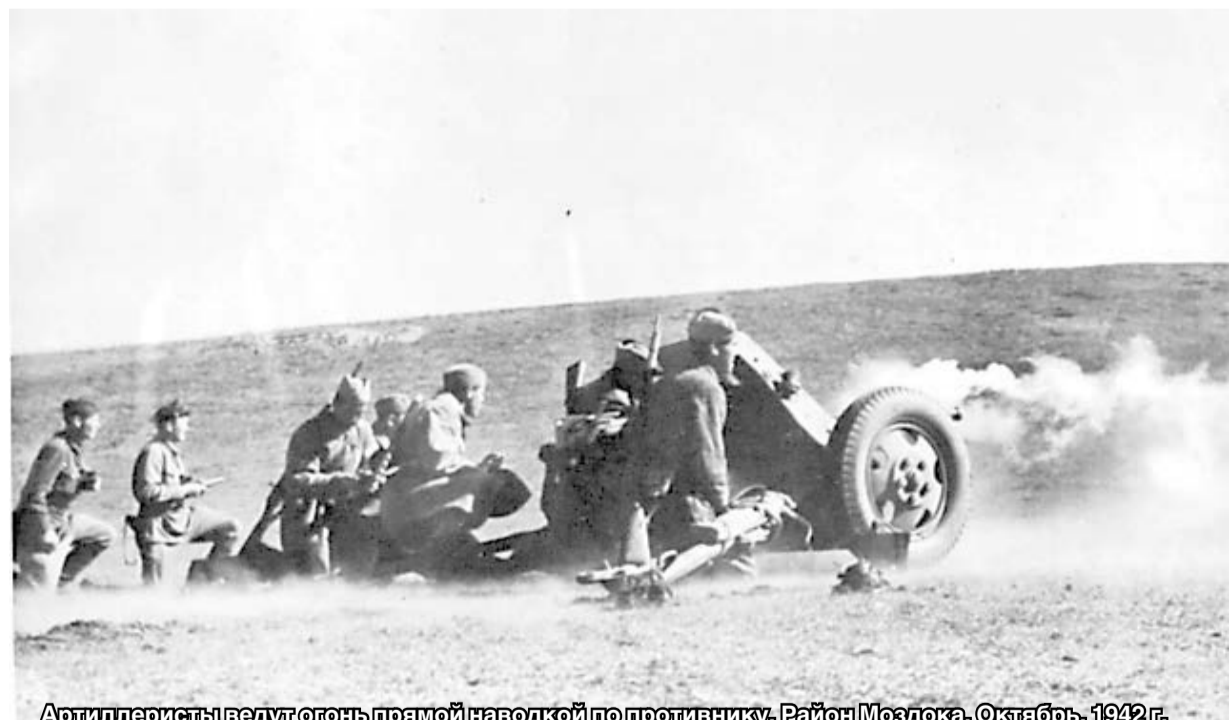
Артиллеристы ведут огонь прямой наводкой по противнику. Район Моздока. Октябрь, 1942 г.