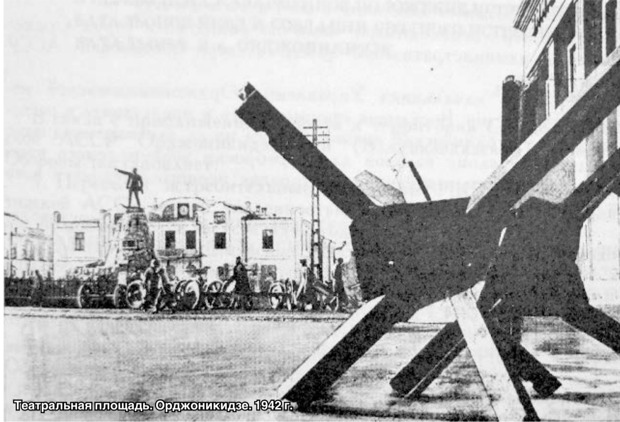
Театральная площадь, Орджоникидзе, 1942 г.

Одним из первых монументальных памятников был десятиметровый обелиск, воздвигнутый в 1953 году на юго-восточной окраине селения Гизель, на братской могиле 200 советских солдат и офицеров, погибших в бою с фашистами. На постаменте памятник выгравировано: «От трудящихся Северной Осетии и личного состава Орджоникидзевского военного училища МВД им. С. М. Кирова курсантам, солдатам, сержантам и