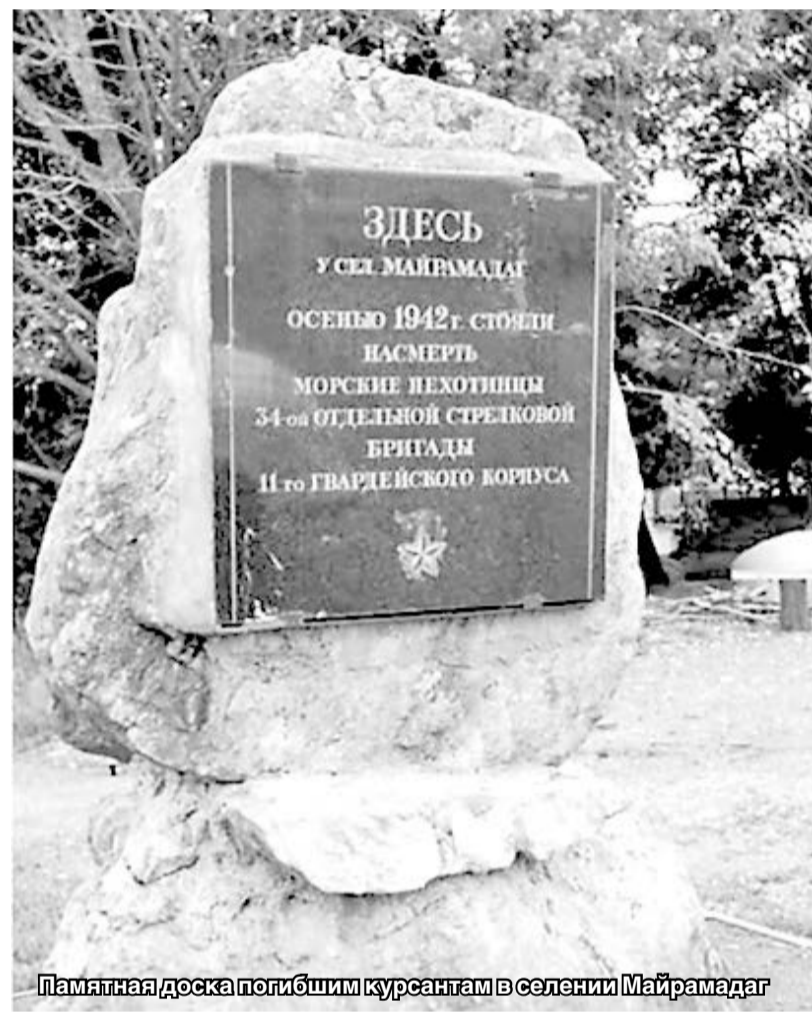
Памятная доска погибшим курсантам в селении Майрамадаг

Но сколько же наших воинов полегло здесь... Именно об этом напоминают нам многочисленные обелиски, установленные по всей Осетии.