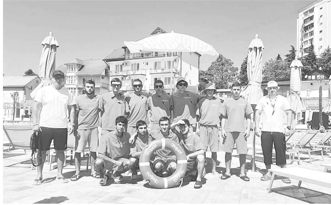
РЕКЛАМА. ОБЪЯВЛЕНИЯ. ИЗВЕЩЕНИЯ

Студенты дежурят ежедневно, стараясь сделать отдых сограждан более безопасным и комфортным. Плюсом является и то, что в процессе они совершенствуют свои навыки спасения людей на воде. Отряд из ЗМК имеет высокий показатель эффективности и оценен на достойном уровне.