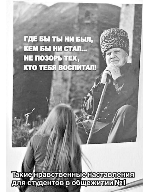
Такие нравственные наставления для студентов в общежитии №1