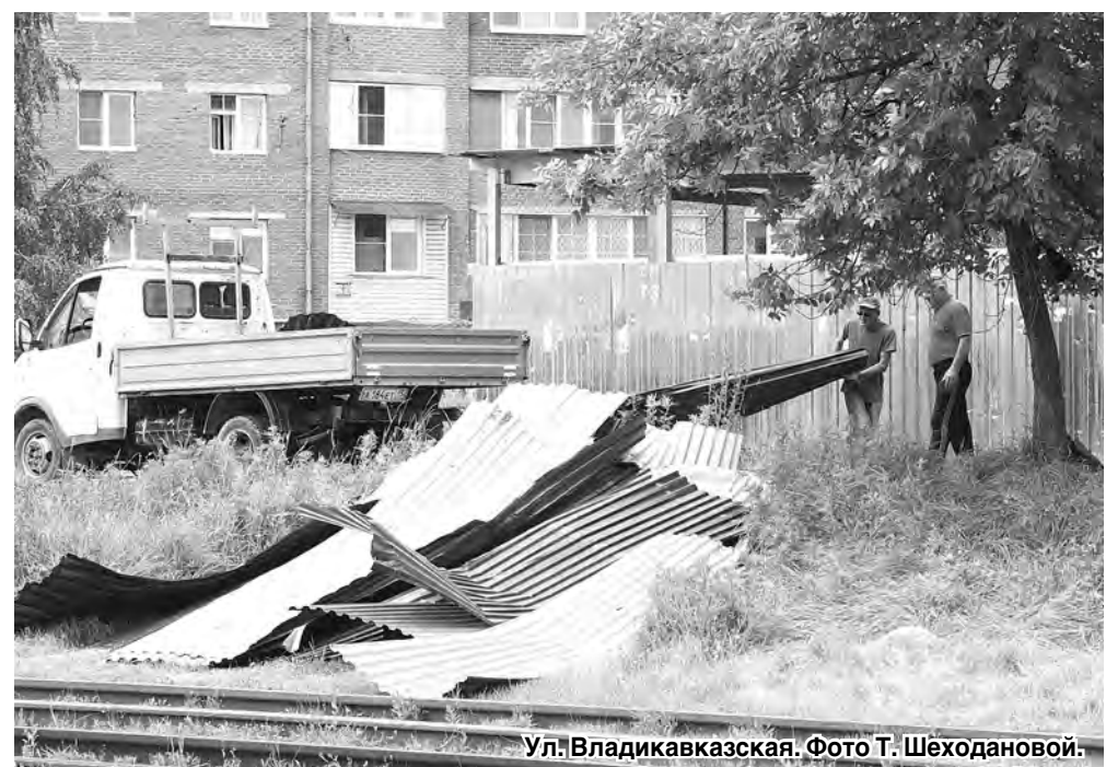
Ул. Владикавказская.