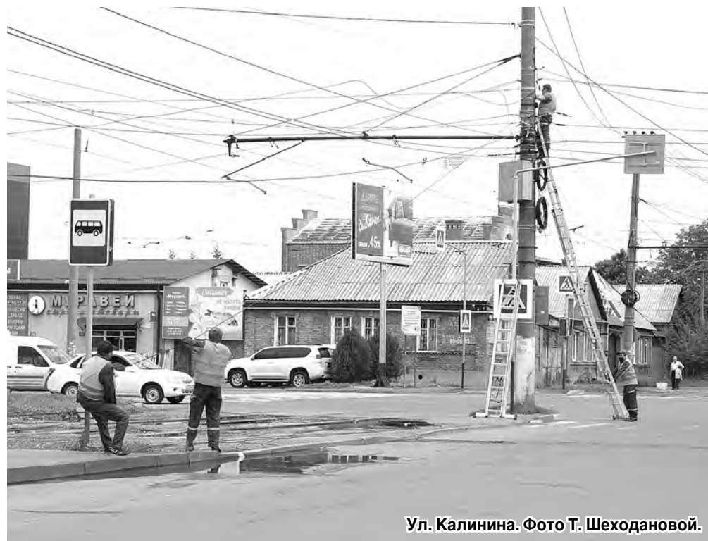
Ул. Калинина.