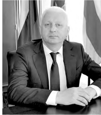
го взыскания долгов не становится меньше в вашей работе?

— Вы не раз говорили о том, что как раз первый блок задач мог бы быть и поменьше. Принудительно-