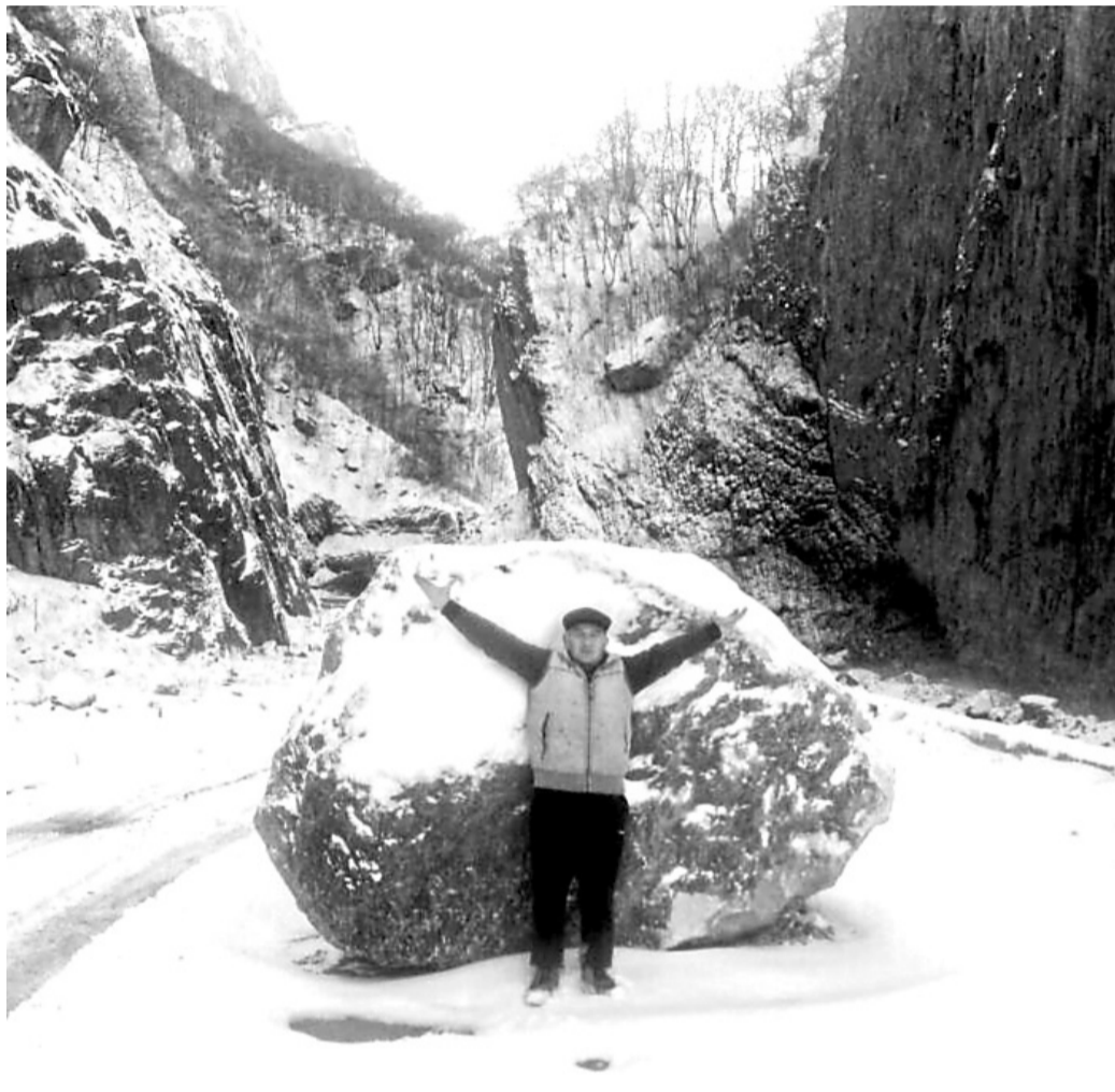
Так выглядит дорога в Старую Санибу