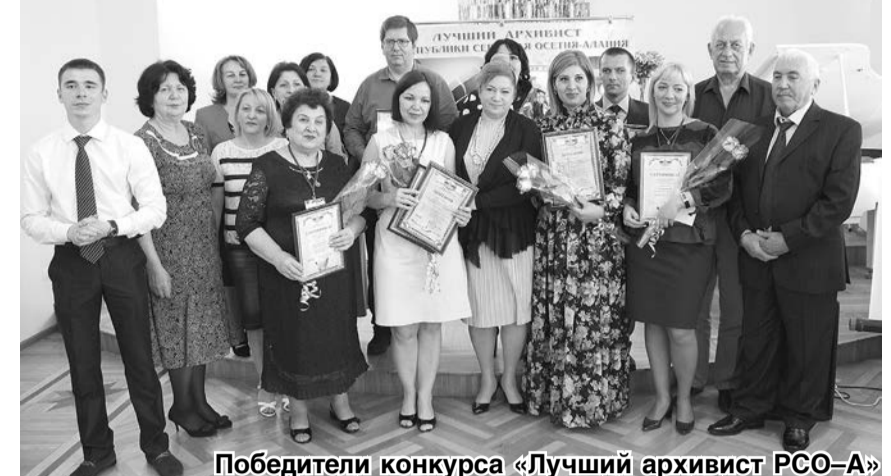
Победители конкурса «Лучший архивист РСО-А»

из документов, связанные с реализацией законных прав и свобод граждан и исполнением государственными органами и органами местного самоуправления своих полномочий. Все эти услуги оказываются бесплатно. Архивы на платной основе исполняют запросы юридических и физических лиц, касающиеся отдельных исторических тем, или генеалогического характера.