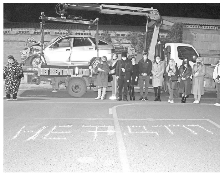
дорожного движения», – рассказала инспектор по пропаганде УГИБДД МВД по РСО-А. В тот же день сотрудники Госавтоинспекции провели акцию, которая призывает задуматься о поведении водителей на дорогах и о печальных последствиях аварий. Искорженый автомобиль как напоминание о трагедиях, в которых погибли или пострадали люди, в сопровождении патрульных машин проехали на эвакуаторе по Владикавказу. Баннер с надписью «Нет жертв ДТП» и призывы из громкоговорителя соблюдать Правила дорожного движения привлекали внимание горожан на всем пути следования колонны. ГИБДД МВД по РСО-А.

Каждое третье воскресенье ноября во всем мире вспоминают людей, погибших в ДТП. Эта дата напоминает всем участникам дорожного движения, что дорога не прощает халатности и ошибок и требует ответственного отношения к Правилам дорожного движения. Во всем мире в результате дорожно-транспортных происшествий ежедневно гибнут более трех тысяч человек и около 100 тысяч получают серьезные травмы. Большая часть из погибших и пострадавших – молодежь. Одно из мероприятий, посвященных Дню памяти жертв ДТП, состоявшееся в автошколе Всероссийского общества автомобилистов во Владикавказе. Инспекторы вместе с курсантами и педагогическим составом автошколы почтили минуту молчания память погибших в ДТП. В знак скорби курсанты выпустили в небо черно-белые шары и подготовили инсталляцию из зажженных свечей в виде надписи «Нет – ДТП!». «Сегодня все мероприятия и акции, которые мы проводим, направлены на привлечение внимания наших граждан к острой проблеме – дорожно-транспортным происшествиям. В авариях мы теряем своих близких, знакомых, коллег, сограждан, которые могли бы многое сделать в жизни, но не смогли из-за преступной халатности водителей. Уверены, что большинство автоаварий можно было бы избежать, если бы строго соблюдались Правила