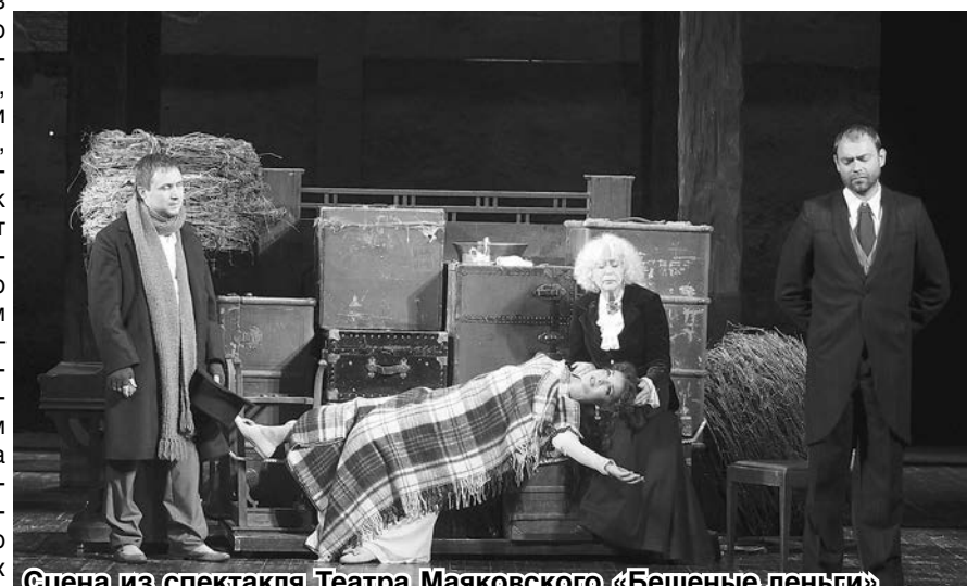
Сцена из спектакля Театра Маяковского «Бешеные деньги»