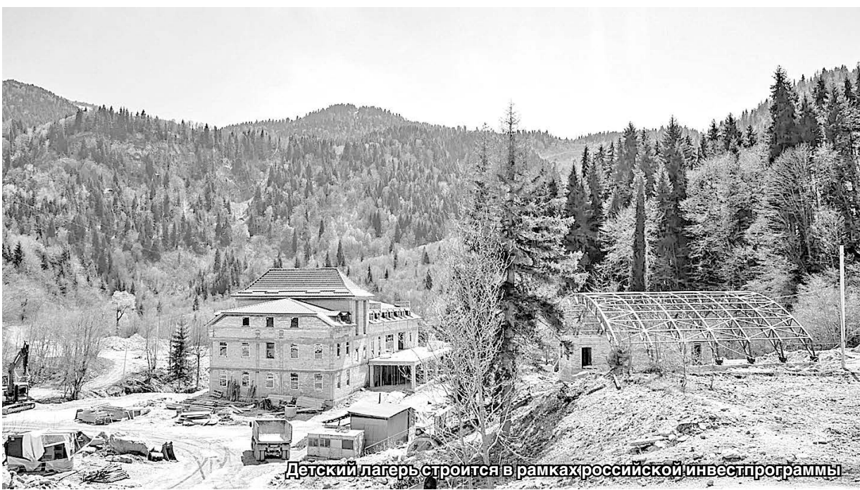
Детский лагерь строится в рамках российской инвестпрограммы

Исходя из внутривнутриполитической и внешнеполитической обстановки,