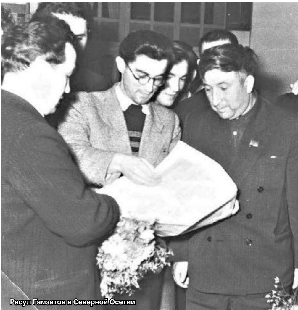
Расул Гамзатов в Северной Осетии

Конечно, Расул не с первых стихов стал зрелым поэтом и мыслителем, народным художником в подлинном смысле слова, хотя талантлив был всегда, от рождения. Читая произведения его в хронологической последовательности, приходишь к мысли о том, что в какой-то период стал «ломаться» голос поэта. Вступление поэта в полосу зрелости происходит, конечно, не в один день и не в одном стихотворении. Это процесс довольно длительный, потому трудно сказать, когда началось его «повзросление».