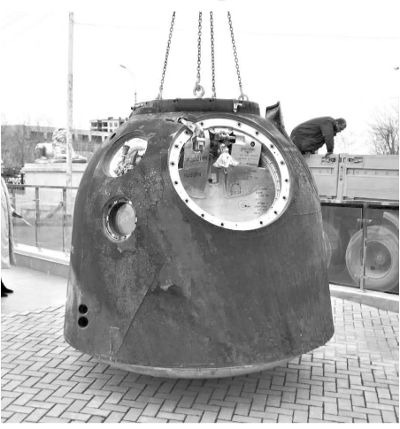
Космический корабль «Союз» был запущен на орбиту 24 ноября 2014 года на ракете-носителя «Союз-ФГ» со стартовой площадки космодрома Байконур. В составе экспедиции находились российский