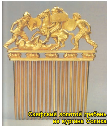
Скифский золотой гребень из кургана Солоха

– Применительно к осетинской версии преданий о Хетаге представляется возможным возводить их к скифской эпохе. В результате главным содержанием преданий о Хетаге становится не столько борьба братьев как таковых, сколько выбор между двумя моделями наследования царской власти: между майоратом и миноратом. Это различие было хорошо известно в этнологии и изучено таким корифеем науки, как Дж. Фрэйзер. В