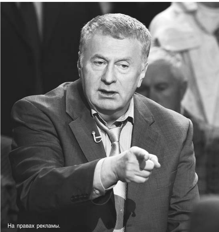
На правах рекламы.

Правительство делает вид, что предложенный им вариант пенсионной реформы безальтернативен, но есть множество других вариантов увеличить пенсии, не поднимая пенсионный возраст, полагают в ЛДПР. Правительство говорит, что в бюджете не хватает триллиона рублей. Действительно огромная сумма, но неужели ее больше неоткуда взять,