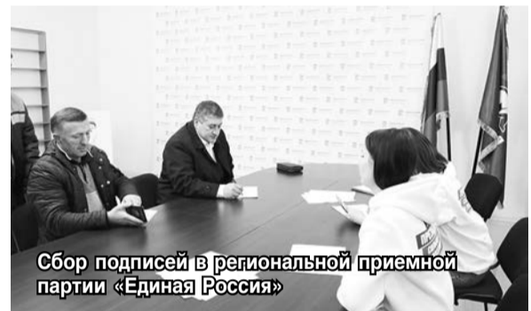
Сбор подписей в региональной приемной партии «Единой России»

«Я выразил свое законное волеизъявление и отдал голос за право выдвижения кандидата в президенты. Для нас важно, с кем в ближайшие годы пойдет вперед страна, в том числе, наша республика», — отметил руководитель РСО-А.