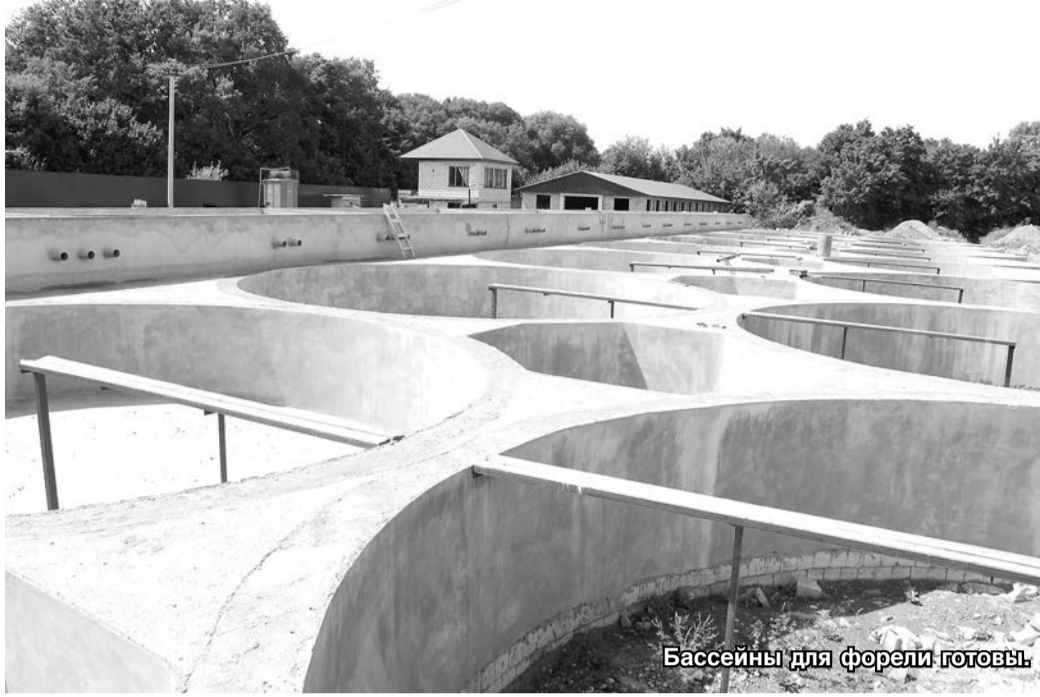
Бассейны для форели готовы.

– Отстаем от графика примерно на 7 месяцев, – с горечью констатирует рыбовод. – Хотя сначала все складывалось хорошо. Власти республики одобрили взаимовыгодный проект, которым предполагается создать 20 рабочих мест для местных жителей, производить в год 200 тонн товарной рыбы, платить в республиканский бюджет миллионные суммы, создать рекреационный комплекс с озером, отелем, рестораном. Уже и место для искусственного озера подготовили. Но тут возникли проблемы с подачей родниковой воды. На ее пути оказались рельсы железной дороги. Прорвать путь для родниковой воды железнодорожники не разрешили. Попытки обратиться к начальству путейцев в Ростов-