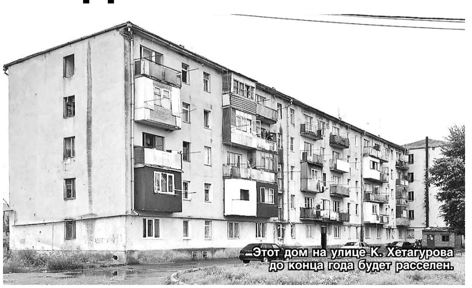
Этот дом на улице К. Хетагурова до конца года будет расселен.

– В настоящее время уже подписаны 135 соглашений о выкупе аварийного жилья. В район поступили 30 процентов софинансирования из федерального бюджета и