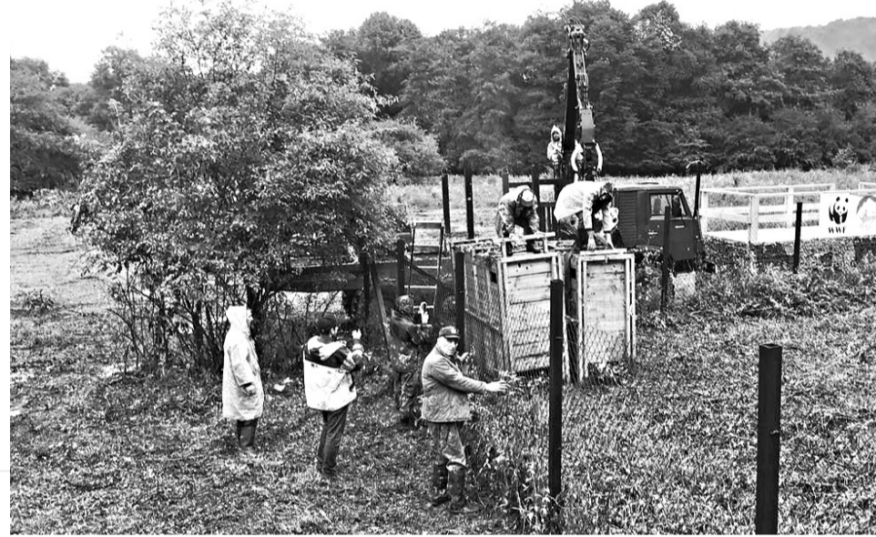
Осетинского государственного природного заповедника при поддержке WWF-России, численность зубров цейской группировки уже превысила 45 особей.

Для Северной Осетии данный выпуск уже третий по счету. Ранее 18 зубров были выпущены в республике в 2010 и 2012 гг.