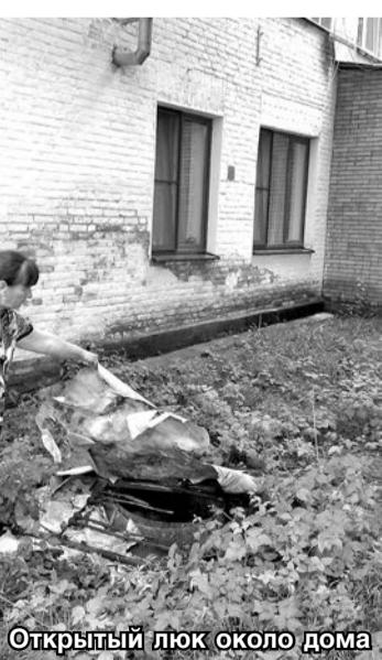
Открытый люк около дома

новые дома подняли, то есть построили на возвышенности. А старые, аварийные корпуса оказались как бы «в колее», то есть во время непогоды вся вода ручьем стекает сюда. И как следствие – плесень, сырющие стены, влажные паласы на первых этажах, мох по низу здания. По словам же Виктории Дудевой, начальника Управления