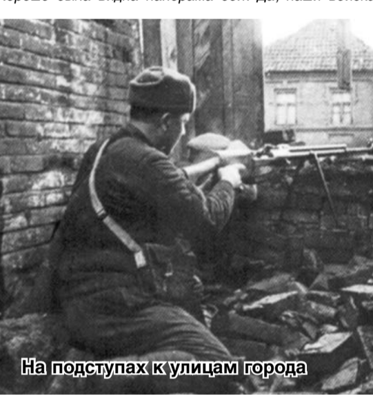
На подступах к улицам города