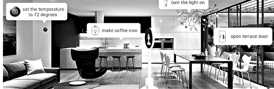
В чем отличие «Умного дома» – «Ростелекома» от простой видеокмеры?

Часто выезжаете в командировки. Этот пункт вытекает из предыдущего с той лишь разницей, что во время командировки дома остается ваш супруг/супруга.