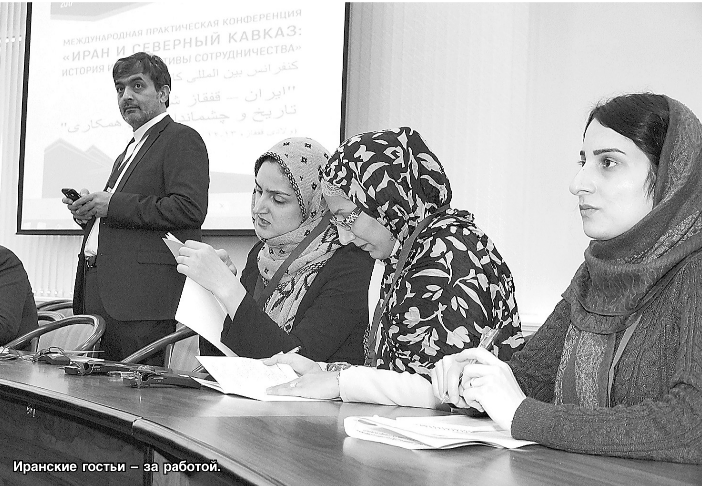
Иранские гости — за работой.

Всеволод РЯЗАНОВ, Людмила ДЖИККАЕВА, Залина ПЛИЕВА.