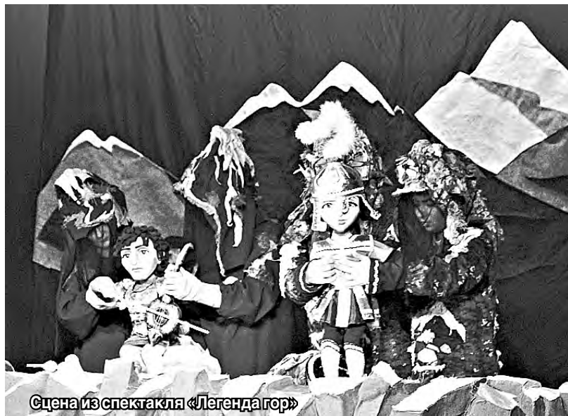
Сцена из спектакля «Легенда гор»