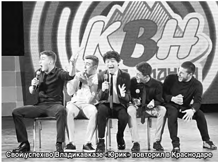
Свой успех во Владикавказе «Юрик» повторил в Краснодаре

С хорошими новостями из Краснодара вернется домой команда, представляющая юридический факультет СОГУ «Юрик», которая, завоевав 4,6 балла, сумела пройти в следующий этап. В январе 2019 года ребята получили путевку-приглашение в Центральную краснодарскую лигу КВН, где провели уже две