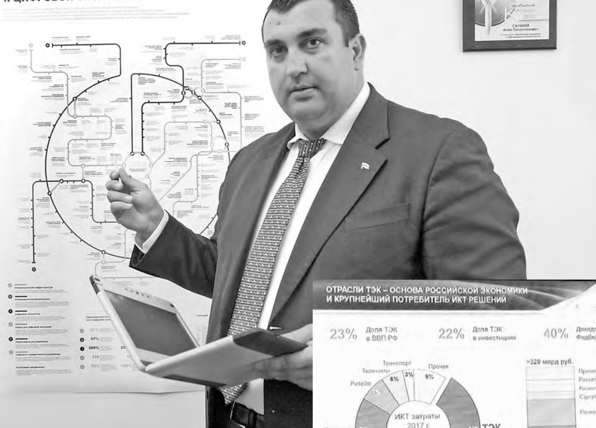
СХЕМА ДВИЖЕНИЯ К ЦИФРОВОЙ ЭКОНОМИКЕ

Национальный проект «Цифровая экономика» включает шесть федеральных проектов: «Информационная инфраструктура», «Цифровые технологии», «Цифровое государственное управление», «Нормативное регулирование цифровой среды», «Кадры для цифровой экономики» и «Информационная безопасность». Всего на его исполнение планируется потратить 1 трлн 634,9 млрд рублей (в том числе 1,1