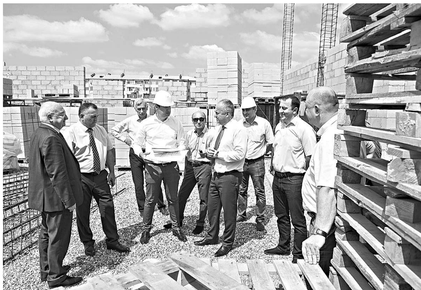
Два строящихся дома культуры в с. Михайловском Пригородного района и с. Коста Ардонского района посетил в ходе инспекционной поездки председатель Правительства РСО-Алания Таймураз ТУСКАЕВ.

В с. Михайловском работы ведутся с июля текущего года, отставания от графика нет, все материалы поступают вовремя, на площадке работают 20 строителей. В настоящее время выполнены земляные работы, завершено устройство ленточных фундаментов, ведется кладка наружных и внутренних стен из легкого стенового блока. В ходе строительства увеличена площадь сцены. Зал, согласно проекту, рассчитан на 300 зрителей. Темпы работ на площадке говорят о том, что уже до 15 ноября вся строительная часть будет завершена.