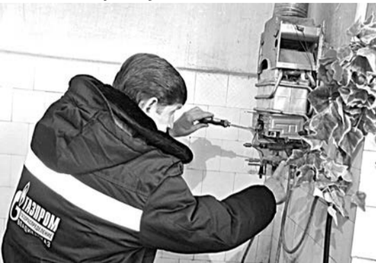
Герман Эдуардович, главный инженер ООО «Газпром газораспределение Владикавказ».

В каждой квартире, в каждом частном доме есть газовое оборудование, будь то газовая плита, отопительный котел или водонагревательная колонка. И все это требует периодического осмотра и обязательного технического обслуживания. Многие жители республики наверняка помнят, как раньше газовики регулярно совершали обходы домов и проверяли газовые приборы, краны, соединения — проводили техобслуживание. С потребителем тогда за эту услугу денег не брали, поскольку ее стоимость была уже включена в тариф на пользование газом. Но с 1 января 2006 года в соответствии с решением Федеральной службы по тарифам стоимость технического обслуживания ВДГО из тарифа за газ была исключена, так что с этого момента техобслуживание стало осуществля-