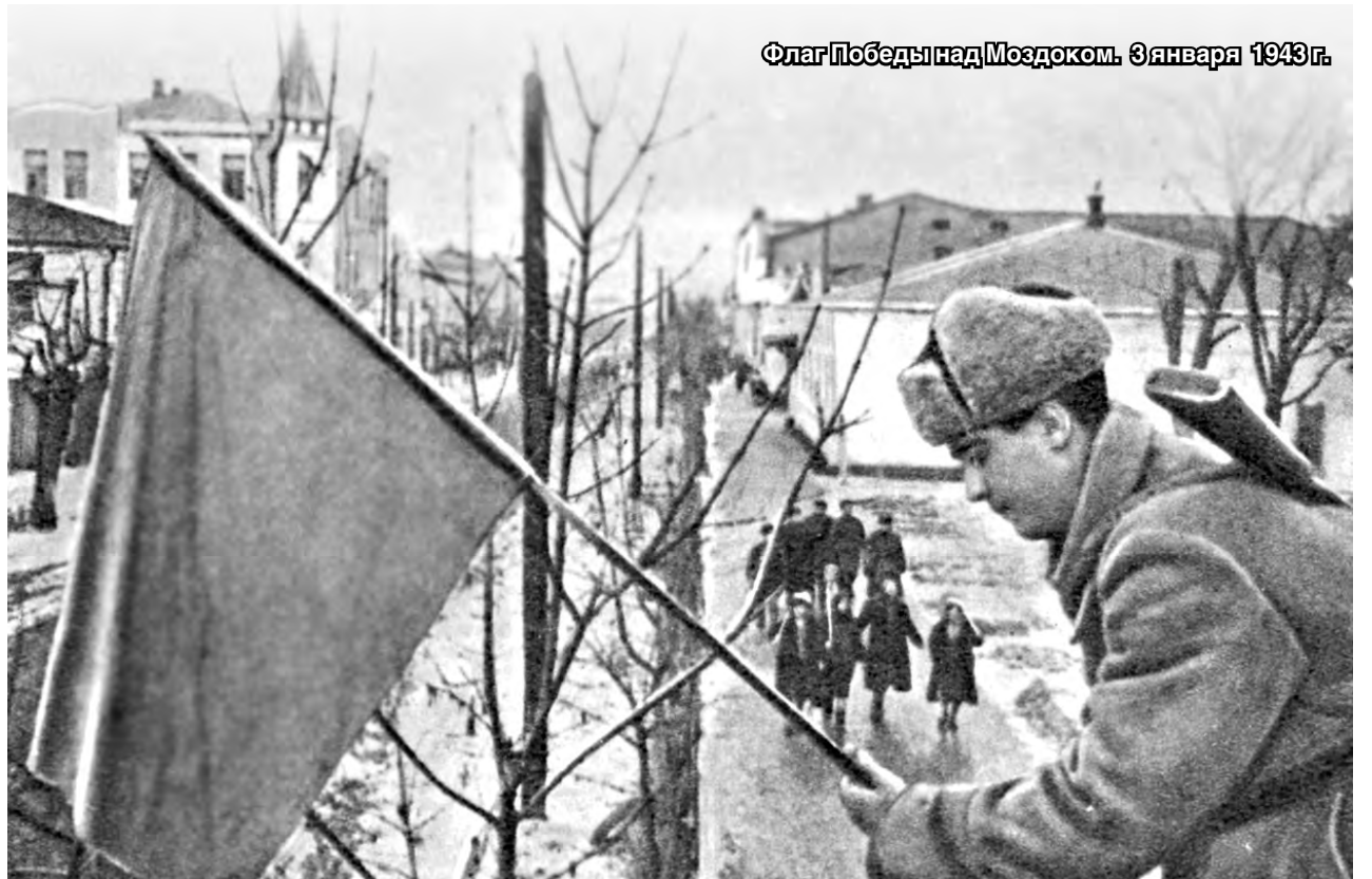
Флаг Победы над Моздоком. 3 января 1943 г.