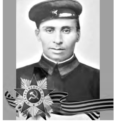
КОЛОЕВ Магомед Созрыкович (1914–1944)