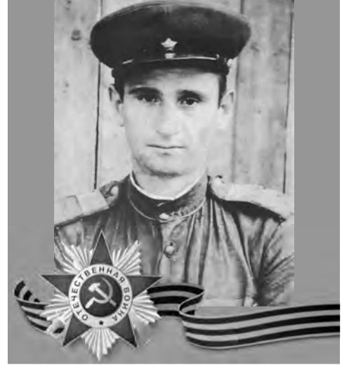
КОЛОЕВ Мухарбек Созрыкович (1916–1971)