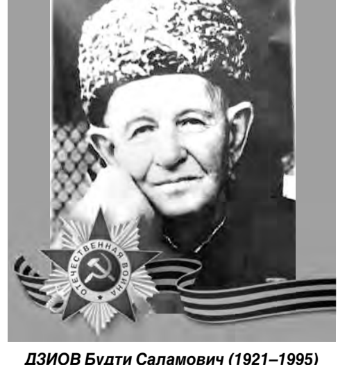
ДЗИОВ Будти Саламович (1921–1995)