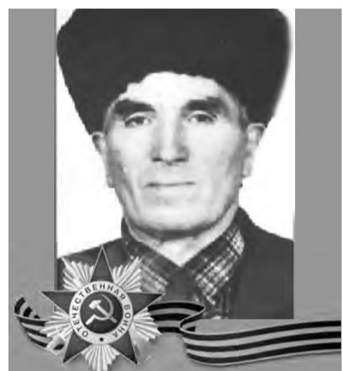
ГАДАЕВ Борис Амурханович (1922–1991)