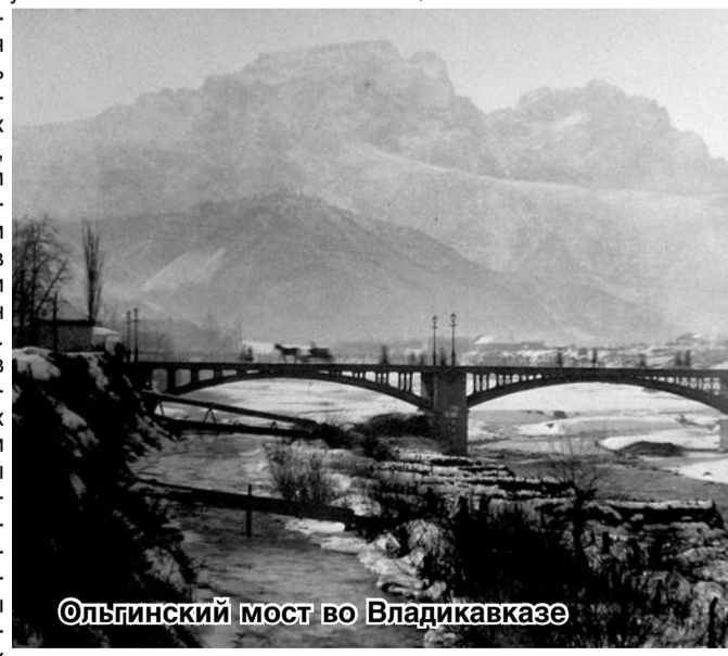
Ольгинский мост во Владикавказе