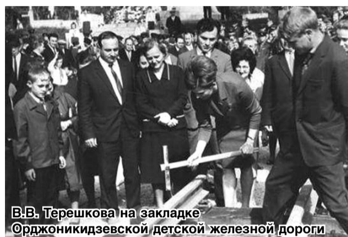
В.В. Терешкова на закладке Орджоникидзевской детской железной дороги

Первая в мире женщина-космонавт совершила свой полет 16 июня 1963 года на корабле «Восток-6», он продолжался почти трое суток.