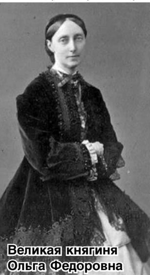
Великая княгиня Ольга Федоровна