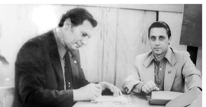
Интервью трехкратного олимпийского чемпиона по вольной борьбе А. Медведя...