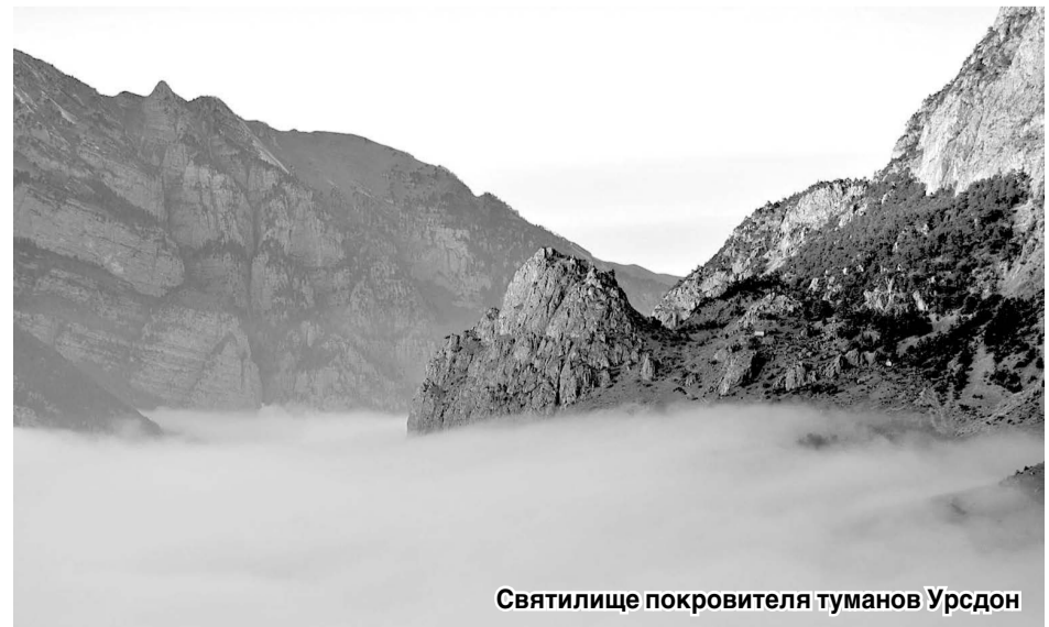
Святилище покровителя туманов Урсдон

Сегодня ФГБУ «Заповедная Осетия – Алания» имеет хороший научный потенциал, устойчивую репутацию, прочные традиции, накопленные за многие годы. И это – благодаря специалистам, которые работают в этом уникальном живом музее природы. В поле зрения ученых постоянно находятся самые интересные и важные объекты – растения, животные, природные комплексы. Вся эта многогранная заповедная жизнь ежегодно отражается в увесистых томах «Летописи природы».