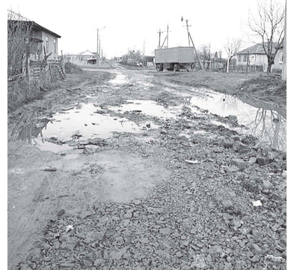
пока остается открытым. «У нас в прошлом году были заложены средства на ремонт трех улиц в Восходе, в этом — всего на две, — рассказал глава поселенца, уточнив, что ул. Братьев Джиевых тоже в списке, но не на 2020 год. — Будем смотреть по бюджету, сколько заложено вообще средств, сколько выделяется. Поэтапно по всему селу мы проводим и освещение, которое непременно дойдет и до ул. Братьев Джиевых».