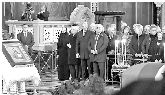
Делегация Северной Осетии приняла участие в церемонии прощания с Юрием Лужковым, которая состоялась в Храме Христа Спасителя.