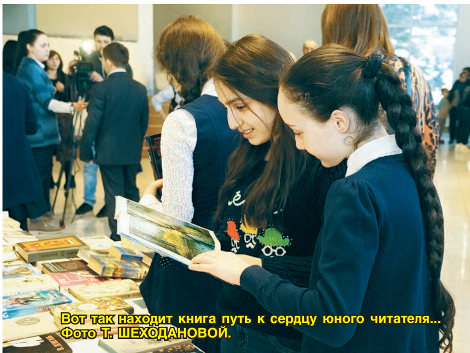
Вот так находит книга путь к сердцу юного читателя...