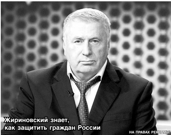
Жириновский знает, как защитить граждан России

Дело не только в том, что страна была совсем другой. Не секрет, что на финальных этапах работы над текстом Конституции руку к нему приложили американские «специалисты», которые чувствовали себя в ельцинской России хозяевами и победителями. Поэтому многое из того, что попало в Основной закон благодаря их участию, вредно нашей стране — и ЛДПР не первый год об этом говорит.