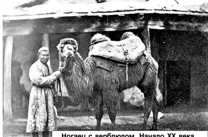
Ногаец с верблюдом. Начало XX века.